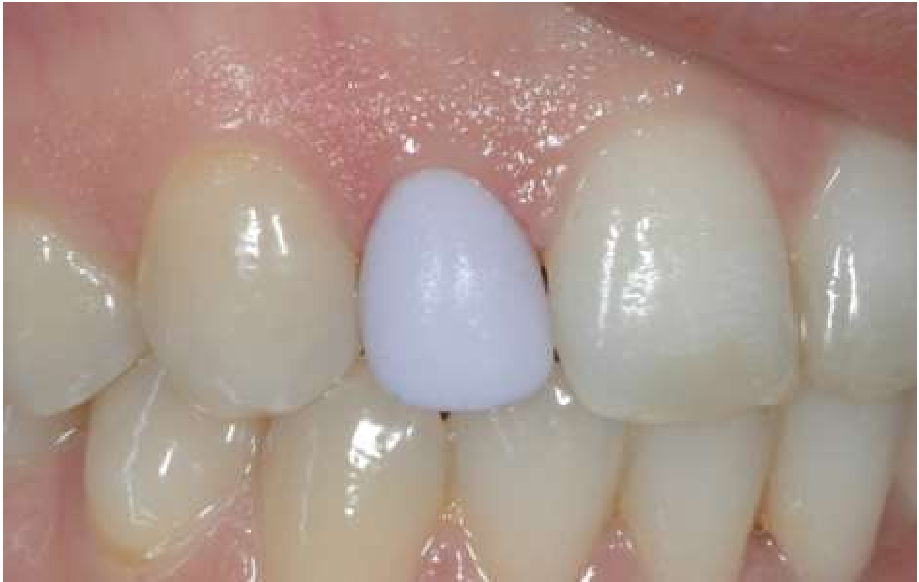
Prova del restauro in pre-cristallizzazione